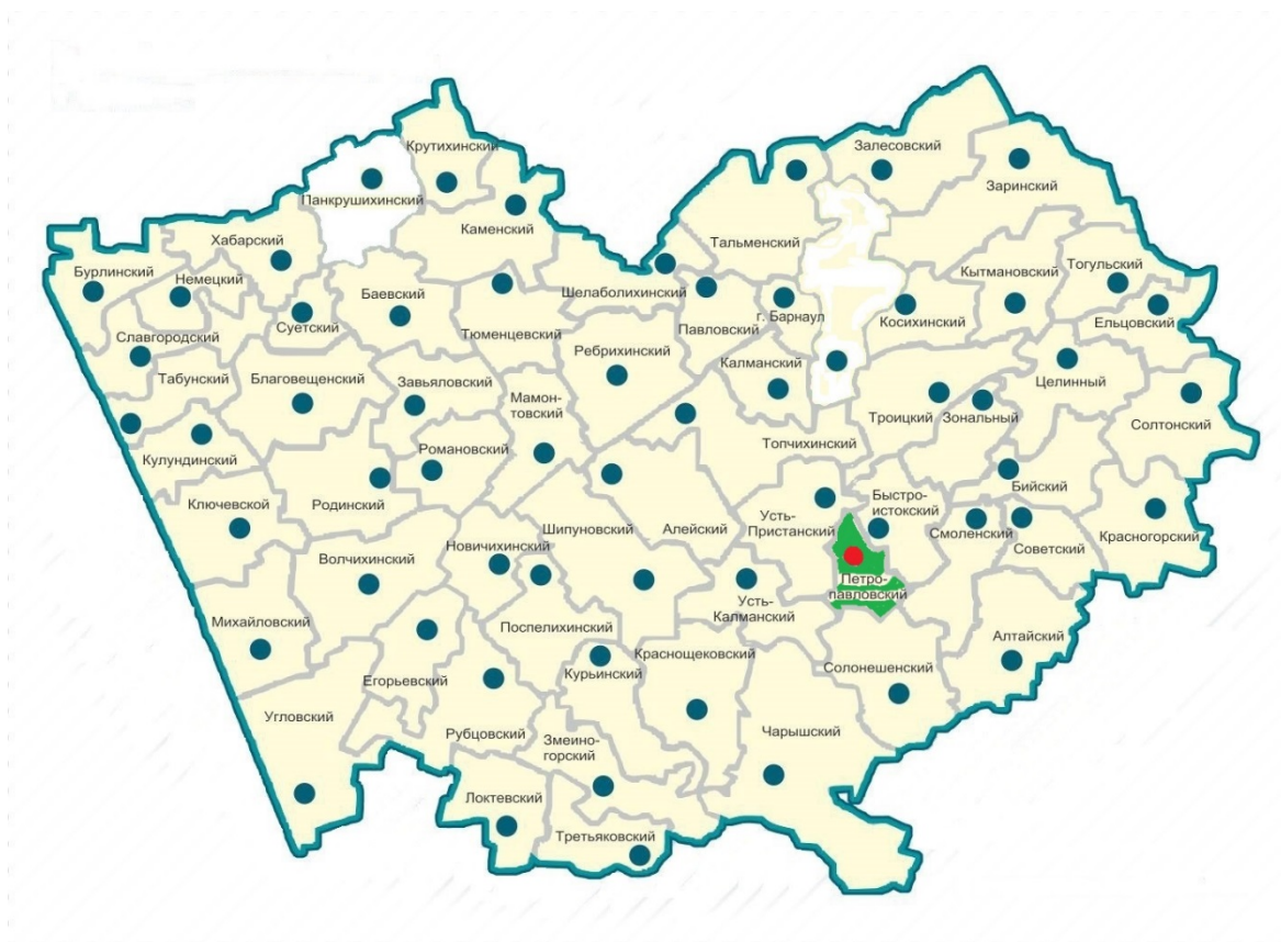
Рис. 1. Географическое положение Петропавловского района