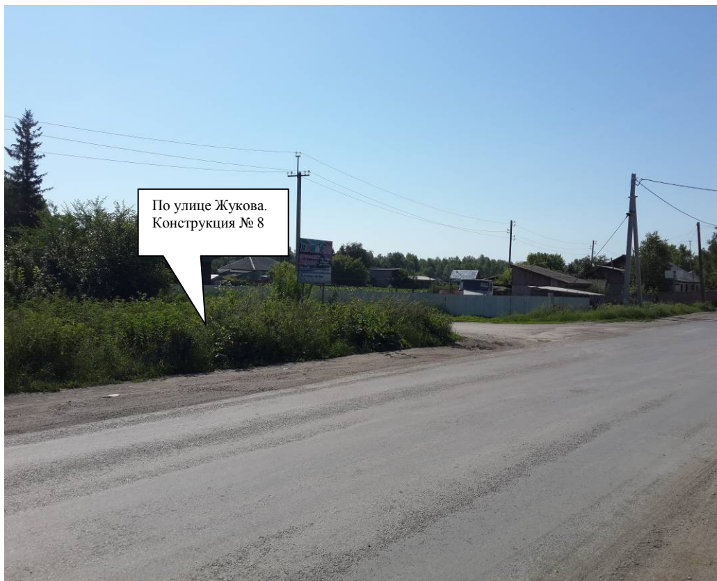
По ходу движения