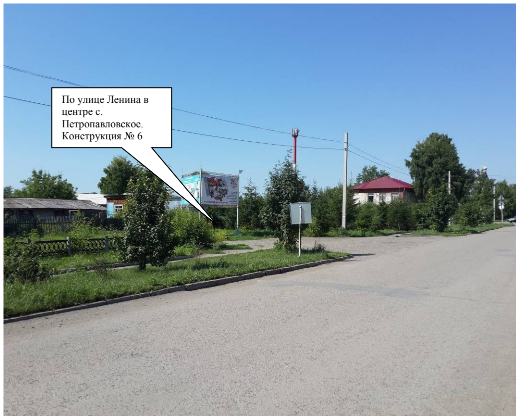
По ходу движения