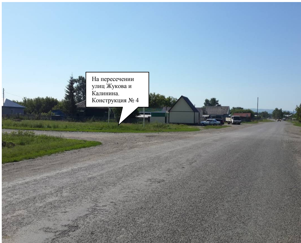
По ходу движения