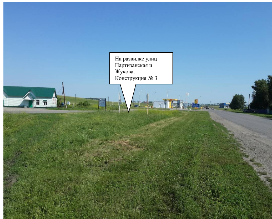
Против хода движения

На развилке улиц Партизанская и Жукова. Конструкция № 3