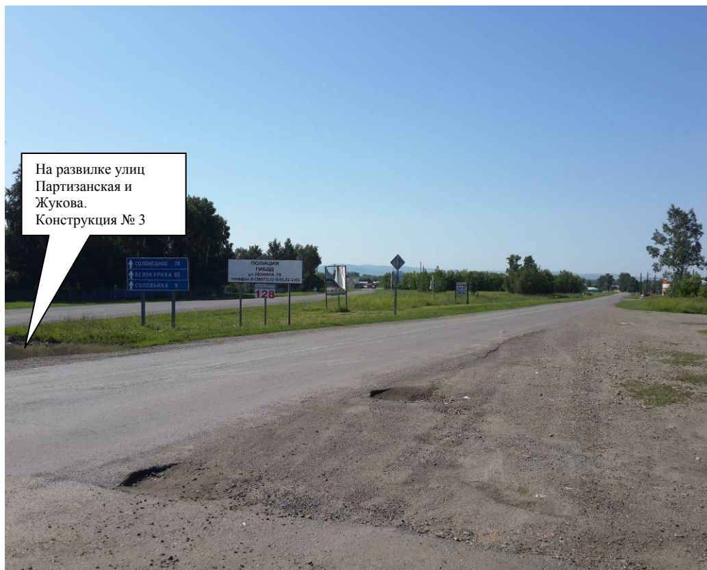
По ходу движения