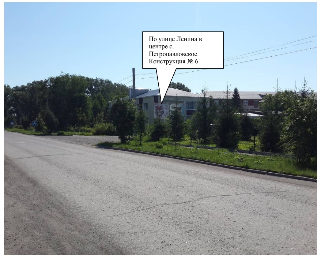
Против хода движения

По улице Ленина в центре с. Петропавловское. Конструкция № 6 (существующая)