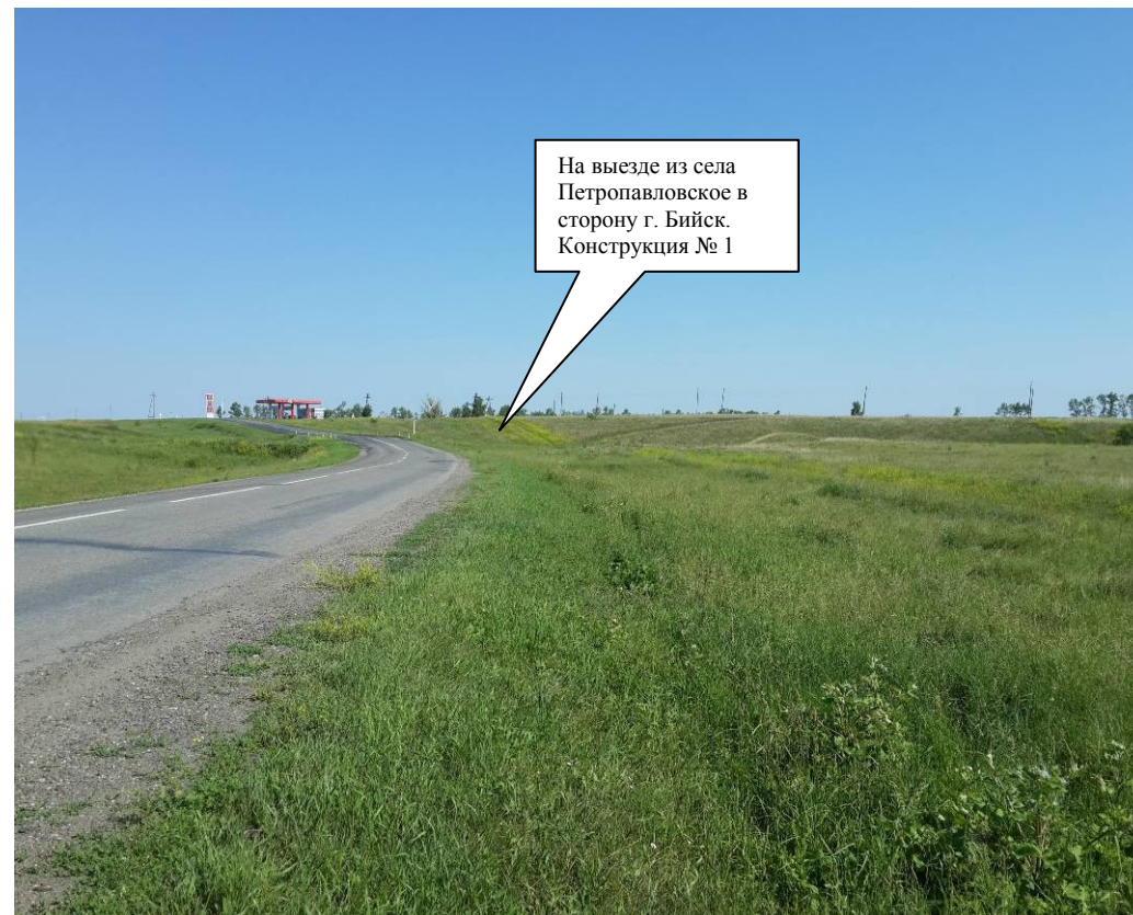
По ходу движения

На выезде из села Петропавловское в сторону г. Бийск. Конструкция № 1