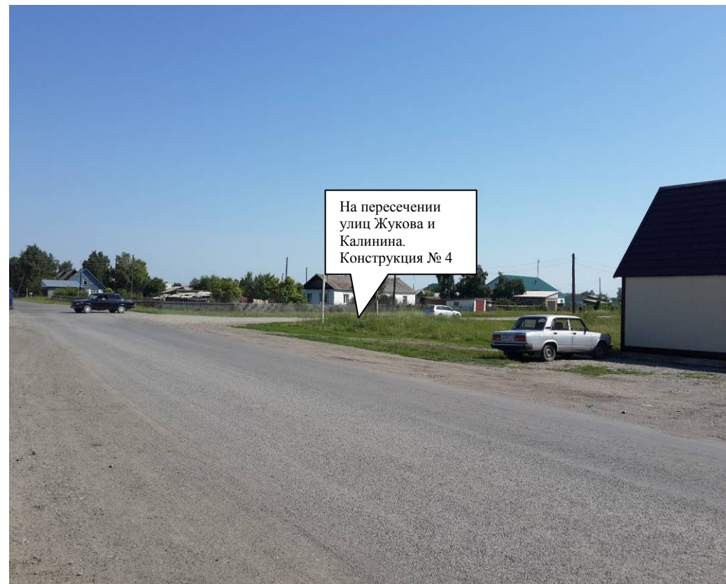
Против хода движения

На пересечении улиц Жукова и Калинина. Конструкция № 4