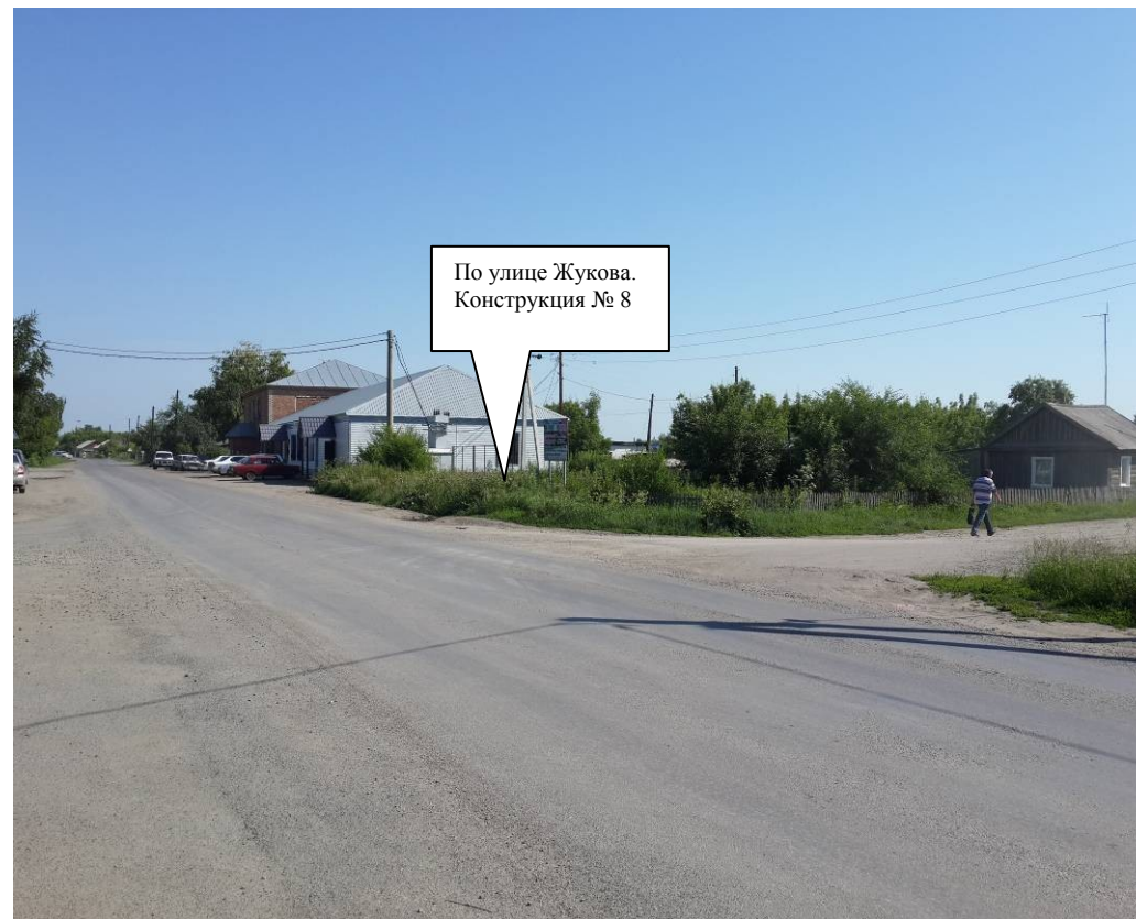
Против хода движения

По улице Жукова в с.Петропавловское. Конструкция № 8