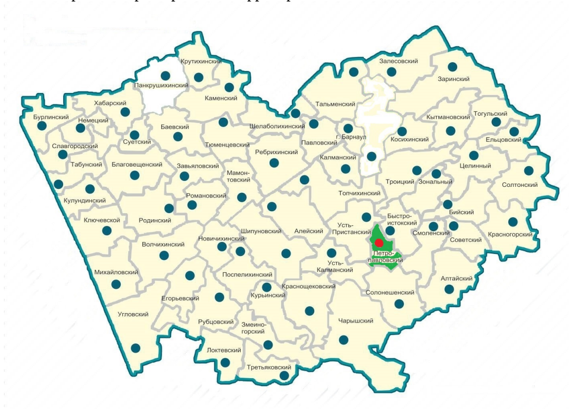
Рис. 1. Географическое положение Петропавловского района

МО Петропавловский район расположен в юго-восточной части Алтайского края. Граничит с Усть-Пристанским районом на западе и северо-западе, на юго-западе - Усть-Калманским районом, Солонешенским районом - на юге, на востоке и юго-востоке - Смоленским районом, на востоке и северо-востоке - Быстроистокским районом. МО Петропавловский район включает в себя 14 населенных пунктов в составе 9 муниципальных образований.